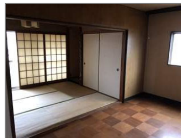
★くつろげる和室・洋室