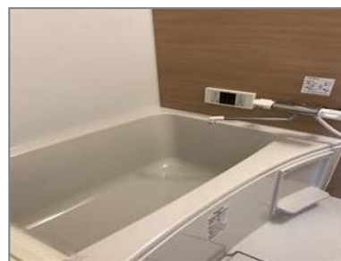
★追炊き機能付バス♪★