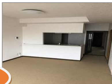
★嬉しいカウンターキッチン♪★