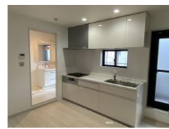
キッチン-使いやすい動線