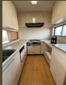
大理石天板のひろびろU字型キッチン

バスルームは 1418 サイズの 大きな浴槽 窓つきで 明るく 風通しも良く 爽やかです