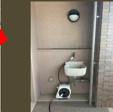
バルコニーには スロップシンクが ベランダガーデニング も楽しめますね