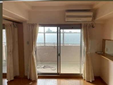
西側のリビングから姫路城を楽しめます