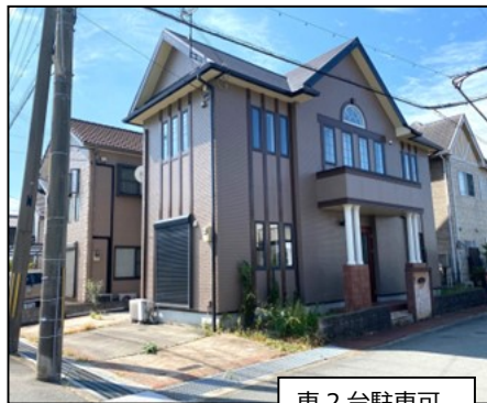
車 2 台駐車可