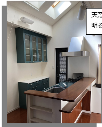
天窓から日が差し込む 明るいキッチン♪